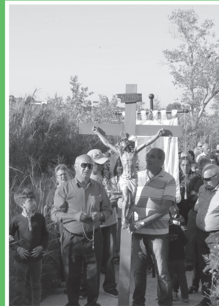
Il-pellegrinaġġ waqt il-laqgħa tas- 6 ta' Mejju 2018